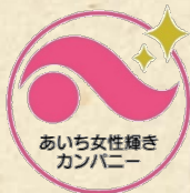
あいち女性輝きカンパニー 認証