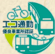
エコ通勤優良事業所認証