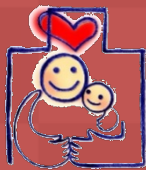
愛知ファミリー・フレンドリー 企業