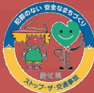
愛知県安全なまちづくり・ 交通安全パートナーシップ企業登録