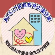
あいちっこ家庭教育応援企業