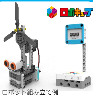
ロボット組み立て例