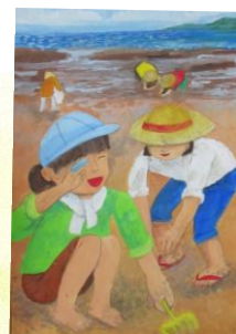
令和5年度 愛知県知事賞作品