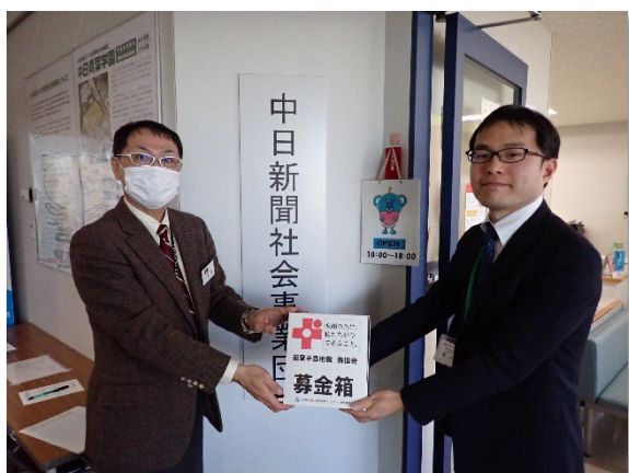
2月28日(水)、中日新聞社会事業団に赴きました。

各施設で集まった義援金は、合計で 85,000円 になりました。皆さまのご協力に心より感謝を申し上げます。