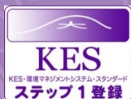
KES 認証 (環境マネジメントシステム)