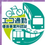
エコ通勤優良事業所認証