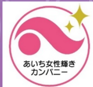
あいち女性輝きカンパニー 認証