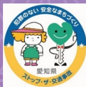
愛知県安全なまちづくり・ 交通安全パートナーシップ企業登録