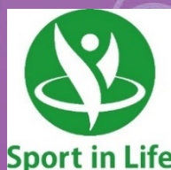
Sports in Life コンソーシアム加盟