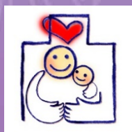
愛知ファミリー・フレンドリー企業