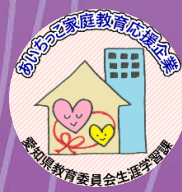
あいちっこ家庭教育応援企業